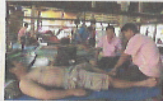
หมอรุ่นพี่สอนหมอรุ่นน้อง โดยให้ลงมือเป็นครู