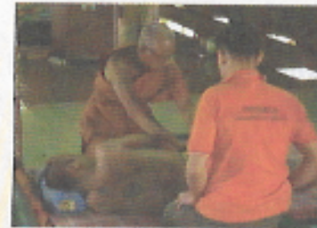
หลวงพ่อดมัยนึ่งตรวจอาการผู้ป่วยด้วยตัวท่านเอง

“ไม่ใช่ห rokok เป็นไขข้อแห้งไอ้ผีนั่นมีจริง แต่มันไม่แบบนี้ ไอ้ปลวกนั่นมีจริง แต่มันไม่ทำแบบนี้ห rokok ไม่ใช่แบบนี้ห rokok...ถ้าจะ เขาเขาไปกิน ก็มียาสมุนไพรไปด้มกินรักษาซะ”