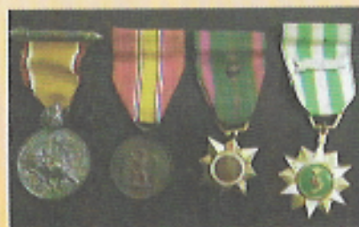
เหรียญที่ระลึกในราชการสงคราม