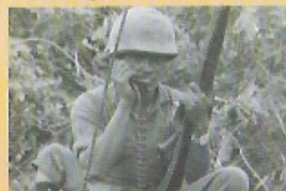
ในสนามรบ ณ จังหวัดเบียนฮว่า สาธารณรัฐเวียดนาม