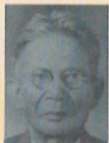
หมอเจี๊ว ฉลาดขี้ขี้