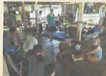
ญาติโยม และคนไข้ ที่มารับการรักษาที่วัด