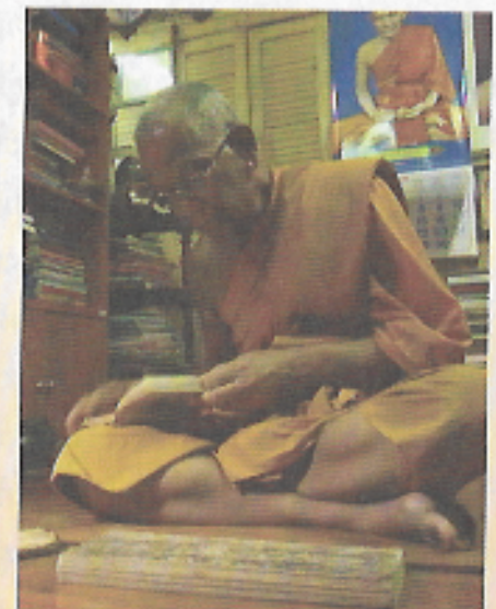
หลวงพ่อดมัยนึ่งมีใบภานของสายพระคุณ

โรงหมอนี้มีการผลิตยาแผนโบราณในรูปแบบยาหม้อ ยาผง ยาลูกกลอน ยาน้ำมันยาประคบ และยาอบ โดยใช้สมุนไพร ไม่ใช่น้อย กว่า ๑๗๐ ชนิด เฉพาะ“ยาอบ” ที่ใช้ในโรงอบไอน้ำสมุนไพร ซึ่งทางวัด เปิดให้บริการมาตั้งแต่ปี ๒๕๒๓ก็มีตัวยาทั้งหมด ๔๓ ชนิด