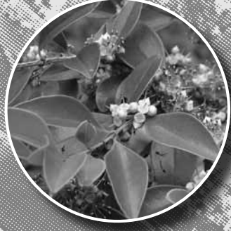
เจตพังคี