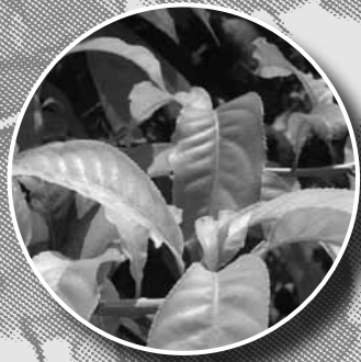
เป็ล้าน้อย