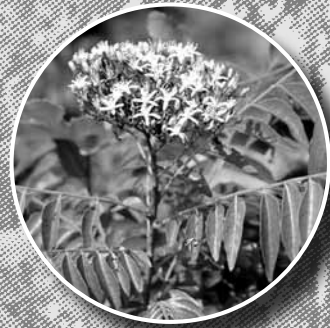
ใบหัสกีน (หัตศคุณ)