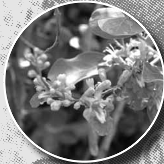
โม่ผีเสื่อน้อย (คนทีขาว)