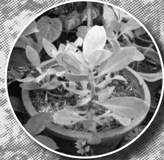
สัพปะปัด (สารพัดพิษ)