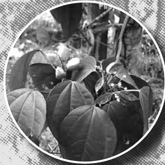
โม่เม่ง (สลอด)